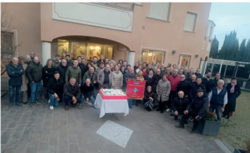
30 Novembre Pranzo Avis