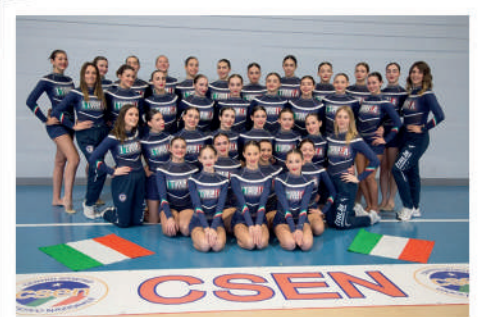
Dicembre Diamond Cheer colognesi ai mondiali in Giappone