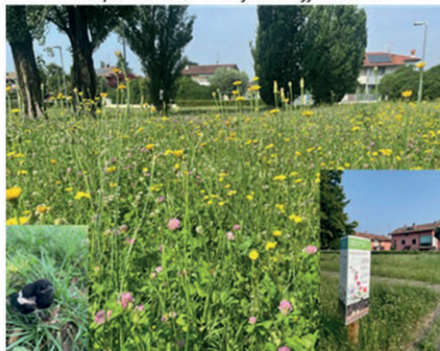
Esempio di risultato di sfalcio differenziato

Ogni albero viene valutato tramite una scheda e gli viene assegnato un livello di rischio, tradotto in un codice colore che indica le priorità d'intervento (controlli, potature, ecc.). Entro il 2026 si prevede di completare il triage dell'intero patrimonio arboreo, stimato in 1.800-2.000 alberi. Questo rappresenta un punto di partenza: l'attenzione verso la nostra foresta urbana è in crescita e, con essa, aumenteranno conoscenza, cura e investimenti sul verde pubblico. Relativamente agli interventi conseguenti al triage, la previsione di spesa è di circa 120.000 euro ripartiti su 10 anni. In inverno e in primavera verranno organizzati per la cittadinanza e per gli studenti dei momenti divulgativi su questi temi. Infine, in zona Campino, sempre in base alle rilevazioni e indicazioni dello studio di agronomia, sono stati effettuati interventi significativi di potatura, sfalcio e abbattimento di alberi ammalorati in modo da mettere in sicurezza l'intera area. Questo intervento è rientrato nelle voci di spesa previste nel contesto del bando regionale Distretti 2022, Intervento 4 – Incremento della mobilità sostenibile, nel contesto della realizzazione del tracciato GiraCologno.