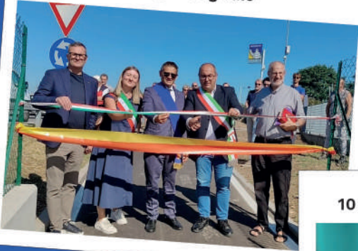
29 Luglio inaugurazione pista ciclopedonale Cologno-Urgnano