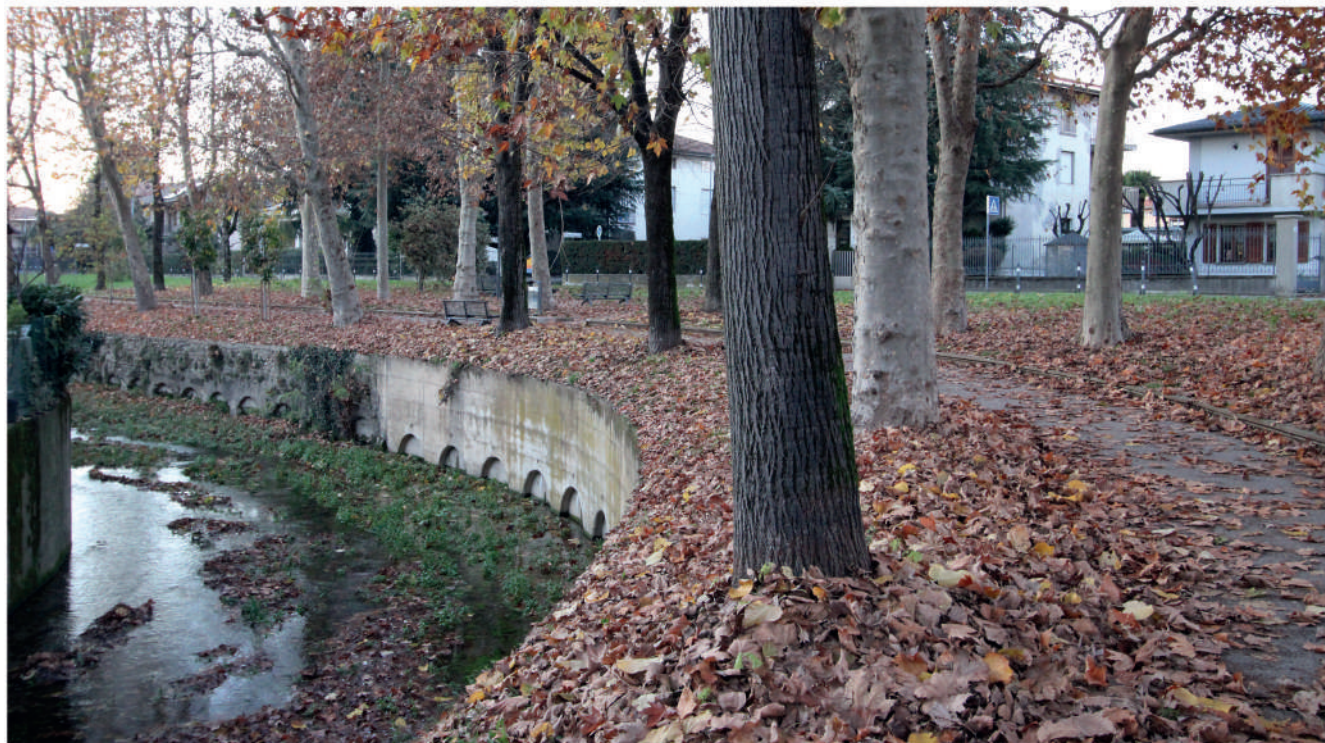
22 Novembre 2025, tratto tra Porta Rocca e Porta Antignano

Ad oggi, nel corso dell'anno sono stati effettuati 3 interventi di manutenzione. Un ultimo intervento, in aggiunta a quelli effettuati, avverrà entro la fine del 2025, per un totale di spesa paria circa 55.000 euro. Gli interventi consistono in: