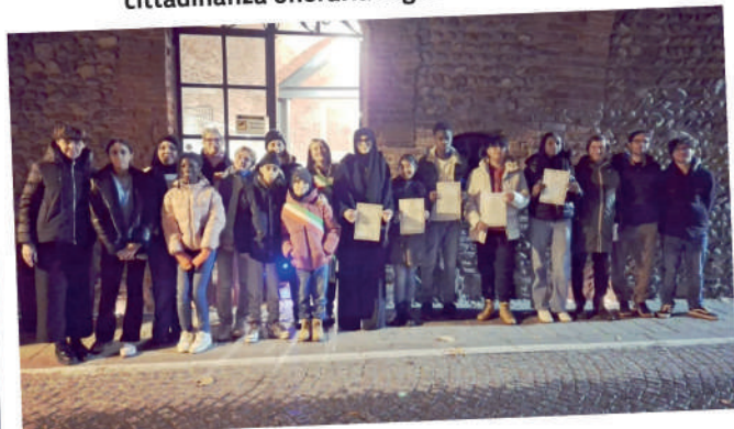
21 Novembre cittadinanza onoraria ragazzi terza media