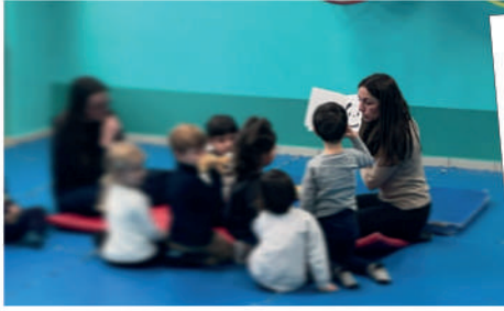
15 novembre 10 anni di API volontari lettura biblioteca