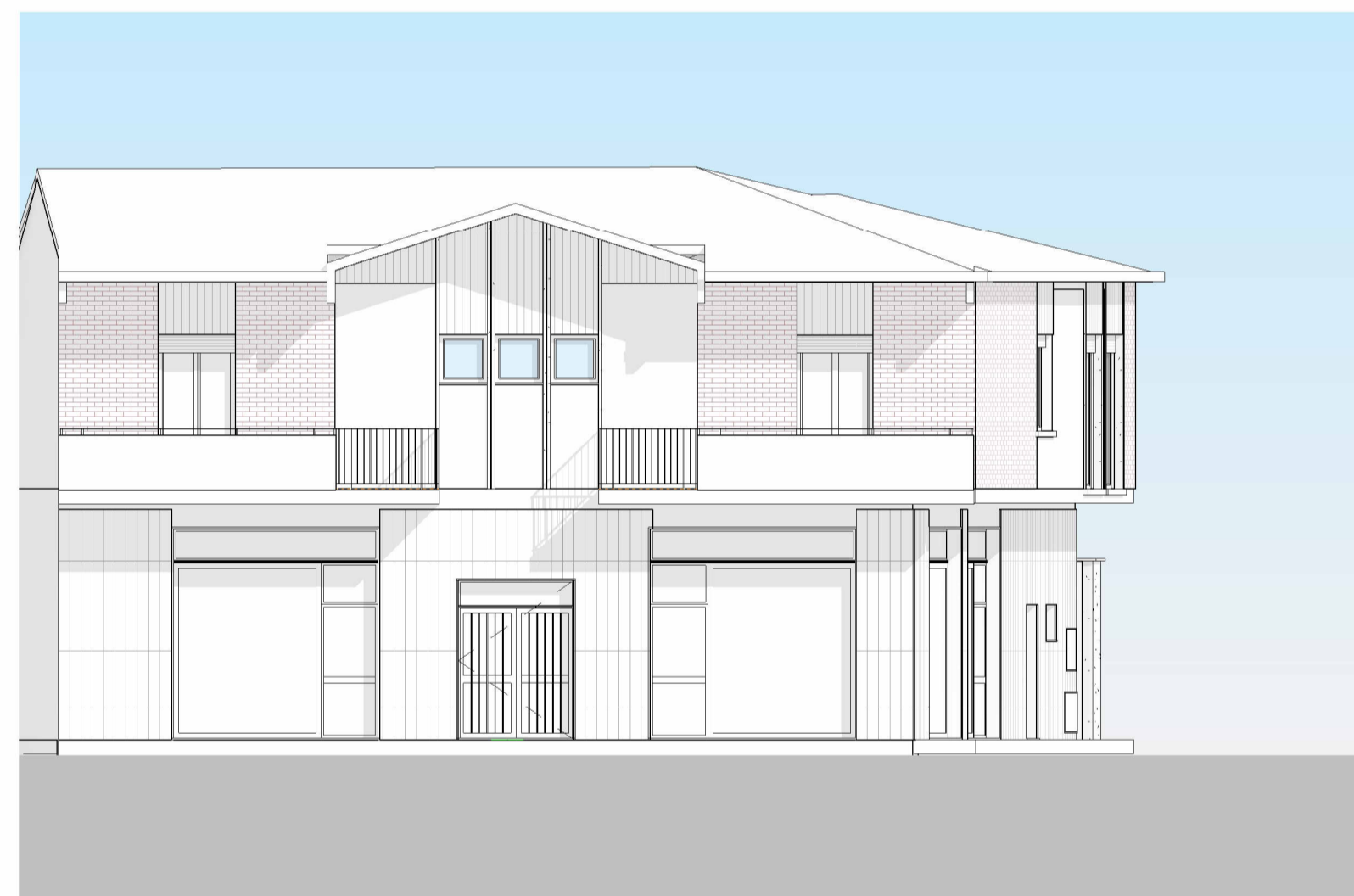
3 PROSPETTO VIA ROCCA - STATO DI FATTO, 1 : 100