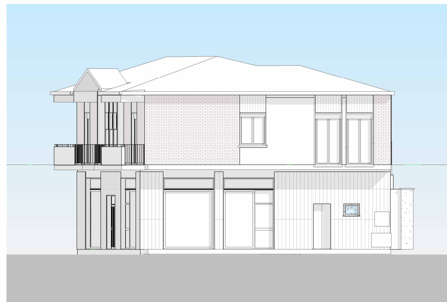
5 PROSPETTO VIA MONS. DRAGO, 1 : 100