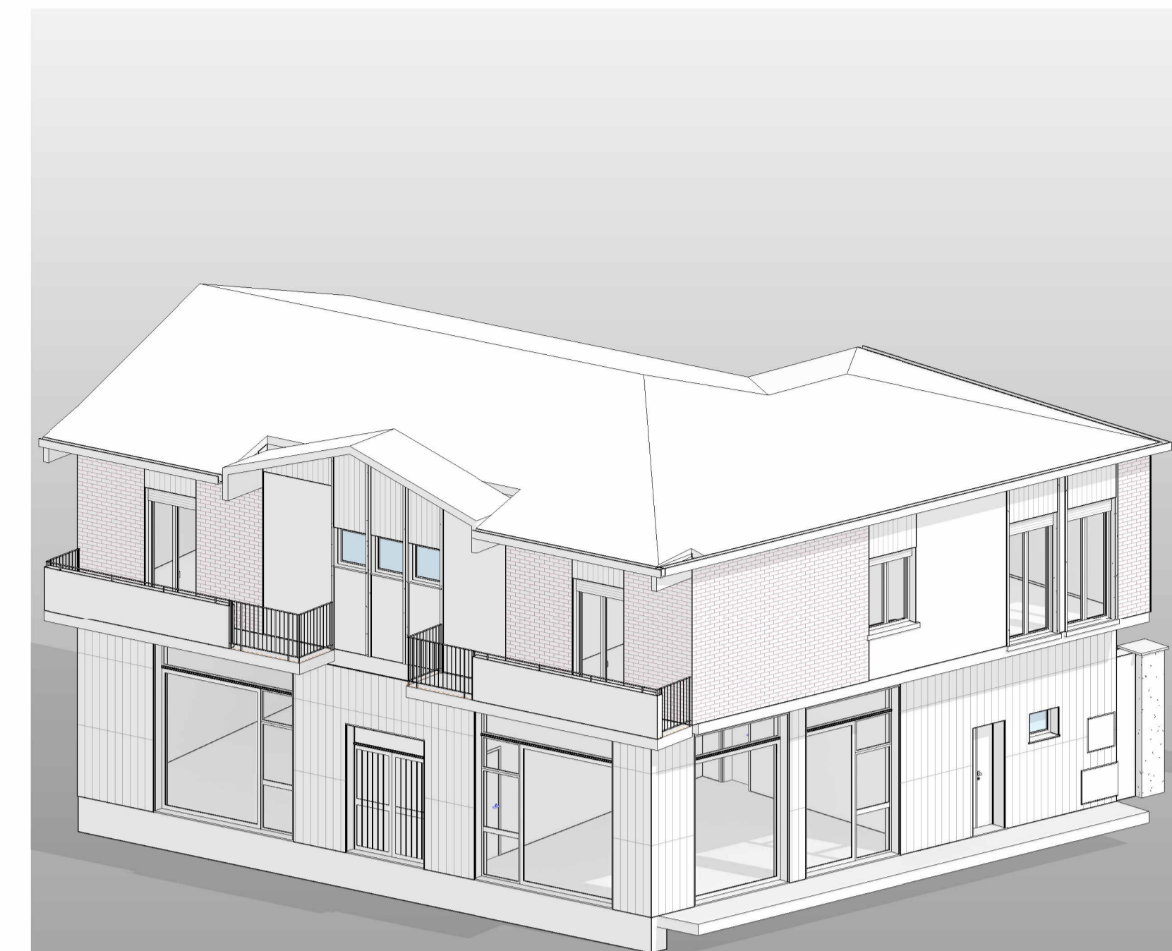
7 MODELLO 3D-BIM - STATO DI FATTO,