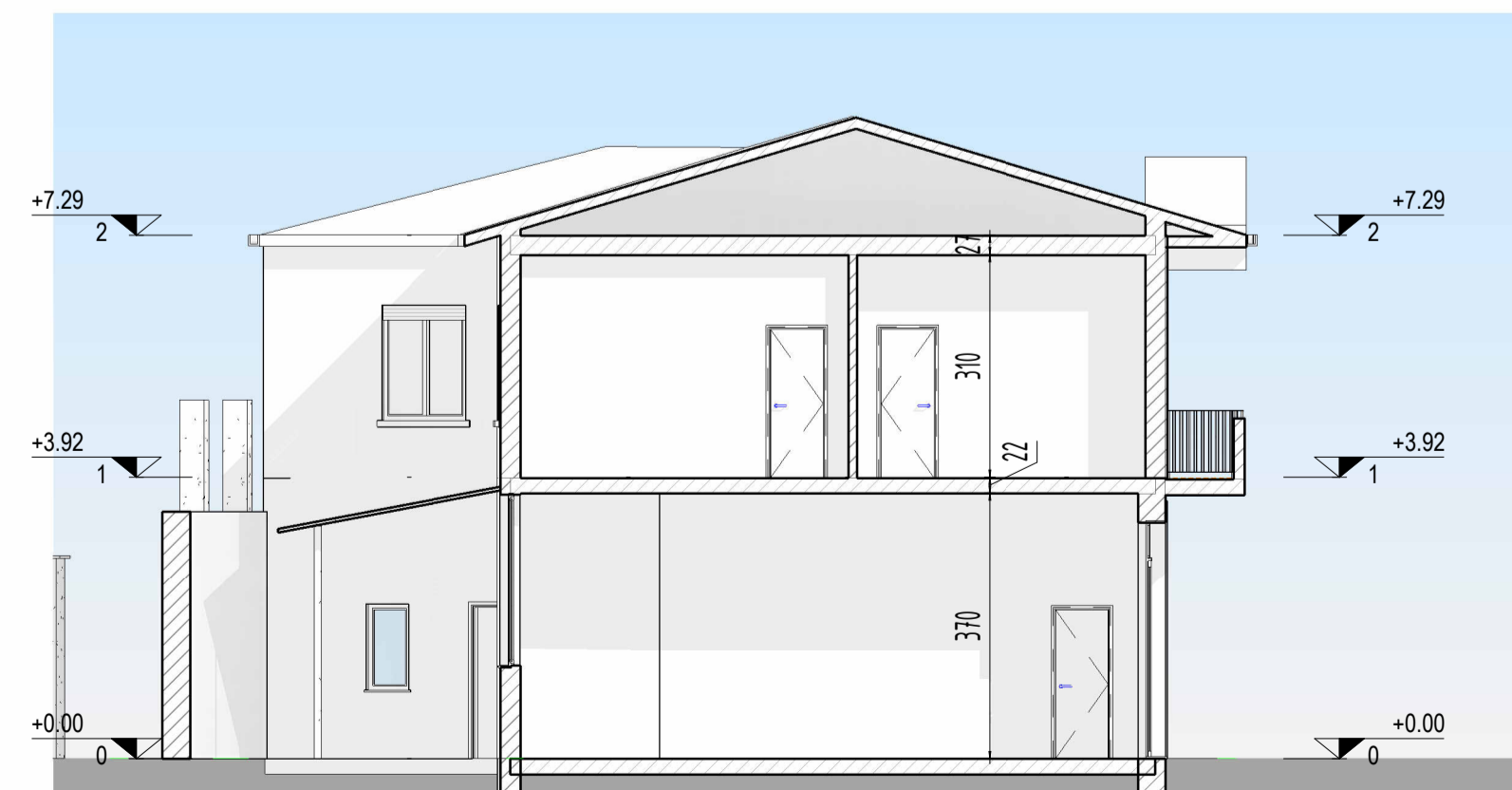
6 SEZIONE LONGITUDINALE - STATO DI FATTO, 1 : 100